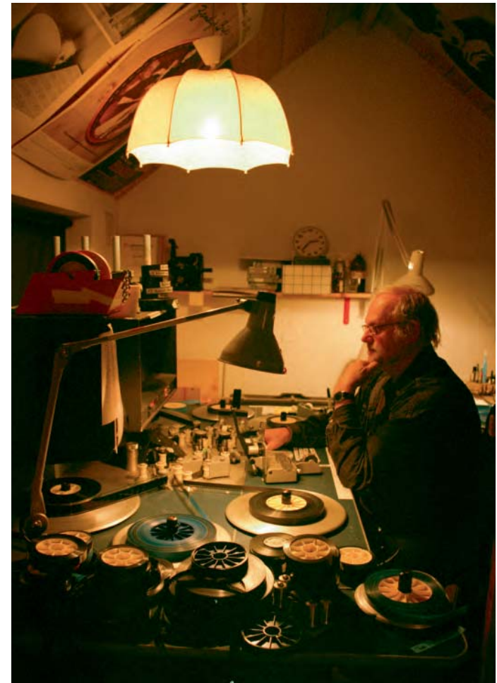
Jan Troell klippte länge sina filmer, från och med Sagolandet , i ett specialbyggt klipprum (ovan) intill hans bostad i Smygehamn. Numera klipper han filmerna digitalt i ett före detta kommunalt fryshus intill hemmet, ett halvt stenkast från havet (till vänster).